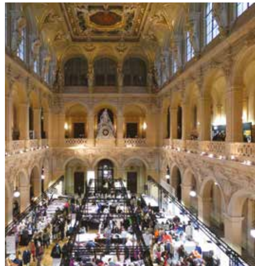
Le Forum Lyon Pôle Bourse aura lieu le 28 septembre dans la salle de la Corbeille du Palais de la Bourse.