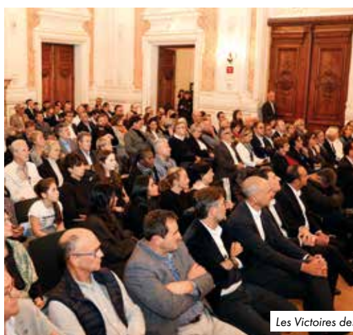
Les Victoires des Autodidactes 2024.