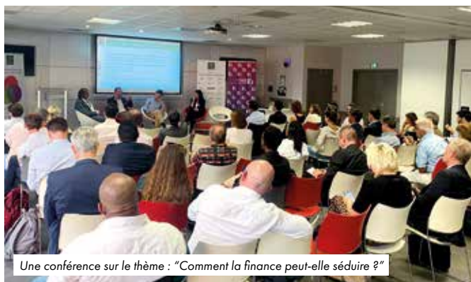
Une conférence sur le thème : "Comment la finance peut-elle séduire ?"

En matière d'outils de communication, l'Application mobile est accessible sur invitation et permet aux membres de suivre l'actualité de LPF, d'échanger et de développer leur réseau. Plus largement, la page LinkedIn partage les actualités, des "live" sur les événements et les publications de LPF alors que le site Internet reste une valeur sûre pour consulter l'agenda, les publications, l'annuaire des membres et les actualités de LPF.