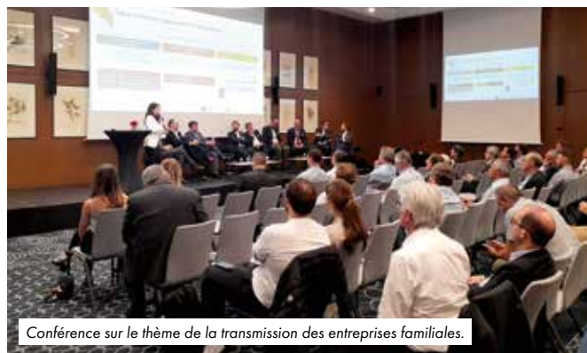
Conférence sur le thème de la transmission des entreprises familiales.